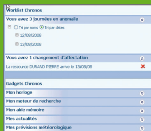
Gestion des alertes

GAIN DE RÉACTIVITÉ SUR LES ÉVÉNEMENTS ET ANOMALIES